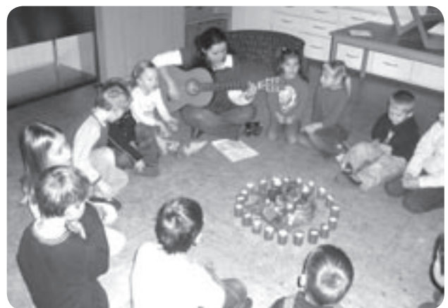
Morgenkreis in der Adventszeit