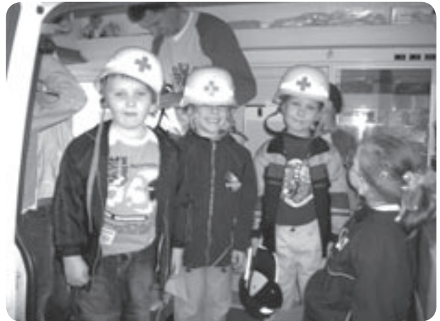
Erste-Hilfe-Kurs: Die Wackelzahnkinder erkunden einen Krankenwagen.