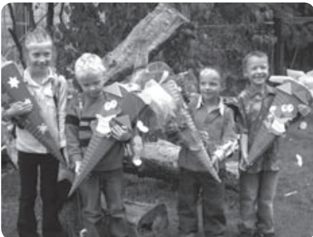
Am 1. Schultag besuchen uns die Erstklässler stolz mit ihrer Schultüte.

An einem Vorkurs „Deutsch lernen vor Schulbeginn“ nehmen jene Kinder teil, deren Eltern beide nicht deutscher Herkunft sind und die einer Verbesserung ihrer Deutschkenntnisse bedürfen. Die Kursteilnahme verbessert Startchancen der Kinder in der Schule. Der Vorkurs, dem eine Erhebung des Sprachstandes des Kindes im vorletzten Kindergartenjahr (Februar/ März) vorausgeht, findet während des gesamten letzten Kindergartenjahres statt. Er beträgt 160 Stunden, die Kindergarten und Grundschule je zur Hälfte erbringen.