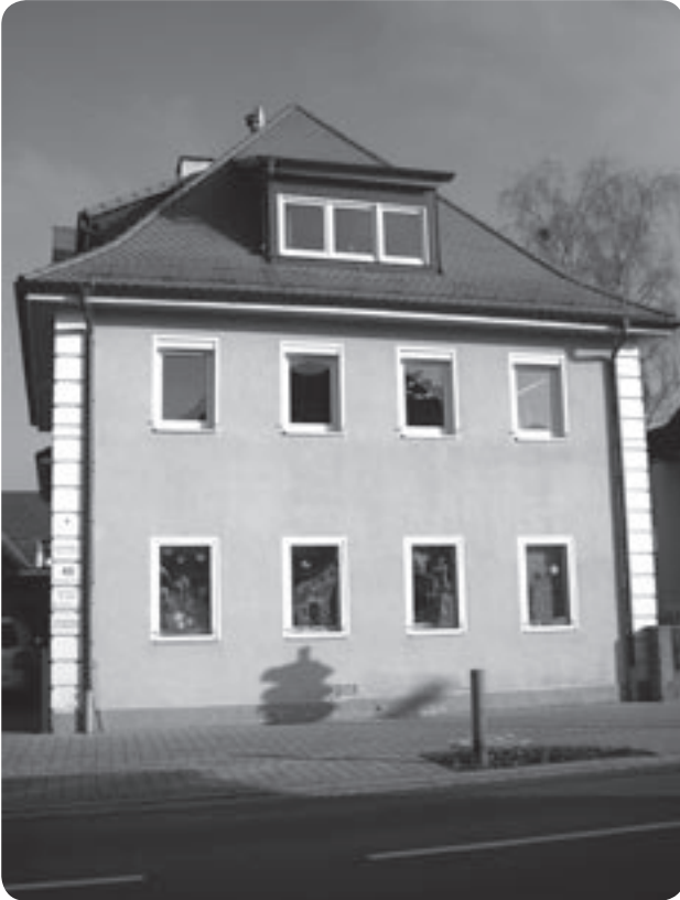
Rückansicht Kita, Nürnberger Str. 48

Unsere integrative Kindertagesstätte liegt im alten Ortskern Hirschaids und erstreckt sich von der Nürnberger Straße bis zur Pestalozzistraße. Wir sind eine 6-gruppige Kindertagesstätte für Kinder im Alter von 8 Wochen bis zur Einschulung: