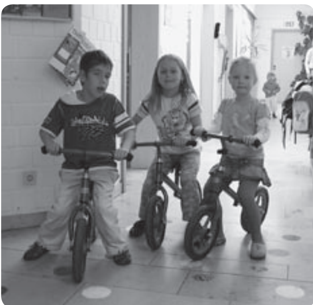
Im Gang ist viel Platz zum Rädchen fahren.

Ideen und Anregungen von Kindern und Eltern bereichern unseren Alltag im Kindergarten. Deshalb nehmen wir diese Ideen sehr gerne auf und setzen sie nach Möglichkeit auch um.