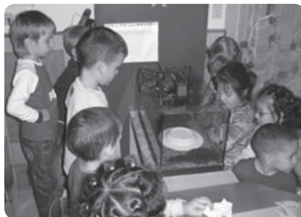
„Wann kommen denn endlich die Fische?“

Das Denken schreitet von Geburt an zunehmend von der sinnlichen Wahrnehmung zu differenzierteren Lösungsformen auf abstrakt-begrifflicher Ebene.