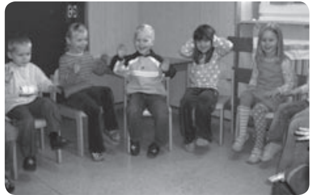
„Komm, wir gehen auf Löwenjagd.“