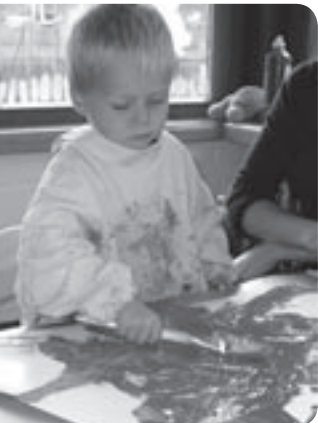
Erste Erfahrungen mit Farbe

Dieses Zitat stammt von Picasso, der einen großen Respekt vor der schöpferischen Kraft der Kinder hatte.