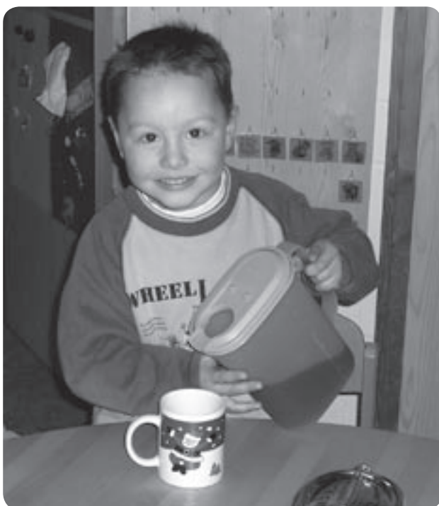
„Ich kann schon alleine Saft eingießen.“

Menschen haben das Grundbedürfnis zu erfahren, dass sie etwas können. Kinder suchen Herausforderungen, die optimal auf ihre Fähigkeiten abgestimmt sind, ihrem Leistungsniveau entsprechen oder geringfügig darüber liegen.