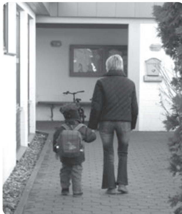
Sicher in der Kita ankommen

Wir sehen den Bildungsauftrag der Kindertagesstätte darin, die Kinder auf die immer schwieriger und komplizierter werdende Umwelt vorzubereiten, indem wir in ihnen die Bereitschaft zu lebenslangem Lernen wecken und ihre Eigeninitiative unterstützen. Es ist uns sehr wichtig, sie während dieser Zeit in einer vertrauensvollen Atmosphäre anzunehmen und ihnen Geborgenheit zu vermitteln. Geborgenheit und Angenommensein bilden die Grundlage für das Wachsen der Persönlichkeit der Kinder und die Entwicklung und Förderung von Lernprozessen.