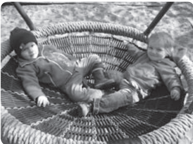
In unserer Vogelnestschaukel fühlen sich alle Kinder wohl.