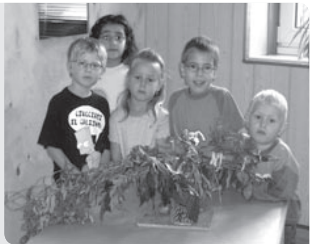
Die Kinder sind stolz auf ihren Vogel.

Die Phantasievögel zeigen die Individualität und den Einfallsreichtum der Kinder. Die Kinder haben ihre eigenen Ideen eingebracht und ihre Vorstellung eines Vogels erschaffen. Sie haben sich zwar grob an die Körperteile eines realen Vogels gehalten (Kopf, Bauch, Flügel, Schwanz, Füße), jedoch sehen diese teilweise sehr interessant aus. So sind die Flügel z. B. keine weiten Schwingen, sondern ein dicker, langer Ast. Die Augen sind nicht in den Kopf integriert, sondern stehen weit nach draußen.