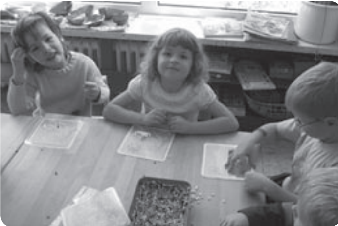
„Mit Bügelperlen legen wir tolle Bilder!“

Spiel ist geistige oder körperliche Tätigkeit, die keinen unmittelbaren praktischen Zweck verfolgt und deren einziger Beweggrund die Freude an ihr selbst ist.