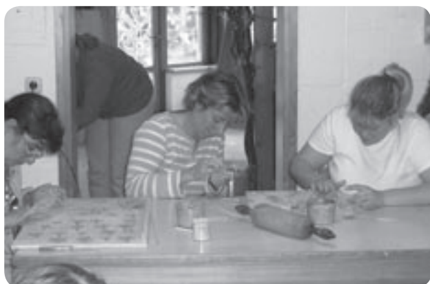
Tonen für den Weihnachtsbasar: Eltern unterstützen uns tatkräftig.

Uns ist es ein besonderes Anliegen, dass zwischen den Eltern und Erzieherinnen ein offenes und vertrauensvolles Miteinander besteht. Auf dieser Basis ist es möglich, den Kindern ein optimales Lernfeld zur Entwicklung der eigenen Begabungen zu bieten. Deshalb ist die Transparenz unserer pädagogischen Arbeit für eine fruchtbare Kooperation mit den Eltern unabdingbar.