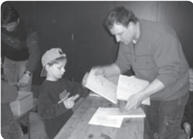
Vater und Sohn bauen einen Nistkasten.