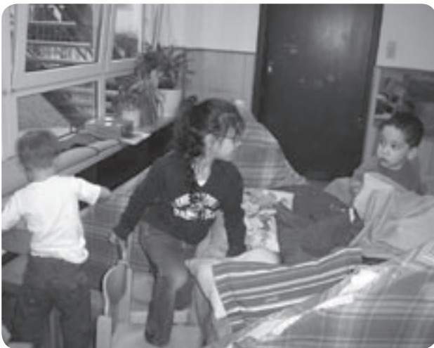
„Komm, wir bauen ein Lager.“

Aktiv sein – als Ausgleich zu Ruhephasen. Allen Kindern unserer Einrichtung – aus Kinderkrippe und Kindergarten – geben wir Gelegenheit zu vielfältigen Bewegungsaktivitäten. Bewegungszonen, z. B. in der Turnhalle, in Nebenräumen und im Flurbereich, stehen den Kindern täglich zur Verfügung und regen sie zur Entwicklung und Erprobung eigener Bewegungsideen an.