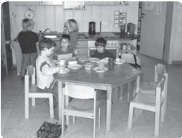
Beim gleitenden Frühstück zusammen mit Freunden