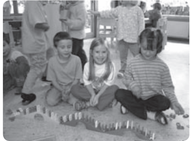
„Wir üben schon für Domino Day!“

Im Freispiel machen die Kinder vielfältige soziale Erfahrungen. Sie lernen, mit Konflikten adäquat umzugehen, sich mit den anderen Kindern auseinan-