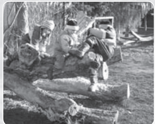
Sitzplatz mit Aussicht: der Kletterbaum