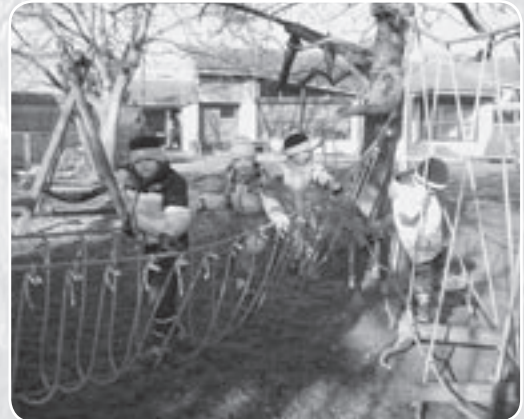
Auf der Seillandschaft