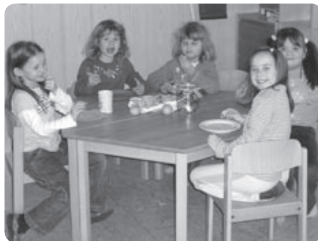
Frühstück mit Freunden

Durch das gemeinsame Aufstellen von festen Regeln, z.B. für das richtige Verhalten beim Spielen im Gang oder im Garten, haben die Kinder einen festen Rahmen, innerhalb dessen sie selbständig handeln und agieren können. Diese Regeln geben ihnen Sicherheit und erleichtern ihnen den Umgang miteinander.