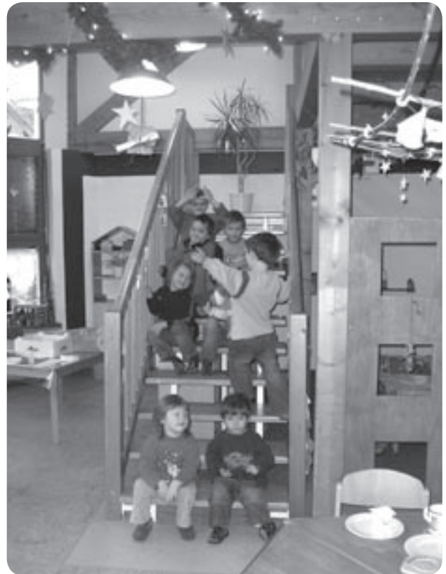
Treffpunkt für Besprechungen