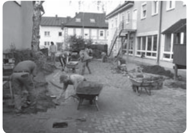
Bei Gartenaktionen sind wir auf viele Hände angewiesen.

In Zusammenarbeit mit dem Elternbeirat wird einmal jährlich ein Referent zu einem von den Eltern gewünschten Thema eingeladen (z. B. Kinesiologie, Gewaltprävention, Homöopathie ...).