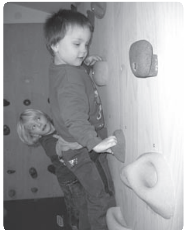
Die Kletterwand ist ein beliebter Treffpunkt für die Kinder.

Uns ist es wichtig, mit den Kindern viel auszuprobieren, Projekte zu veranstalten, Elternaktivitäten zu initiieren und flexibel auf Wünsche zu reagieren.