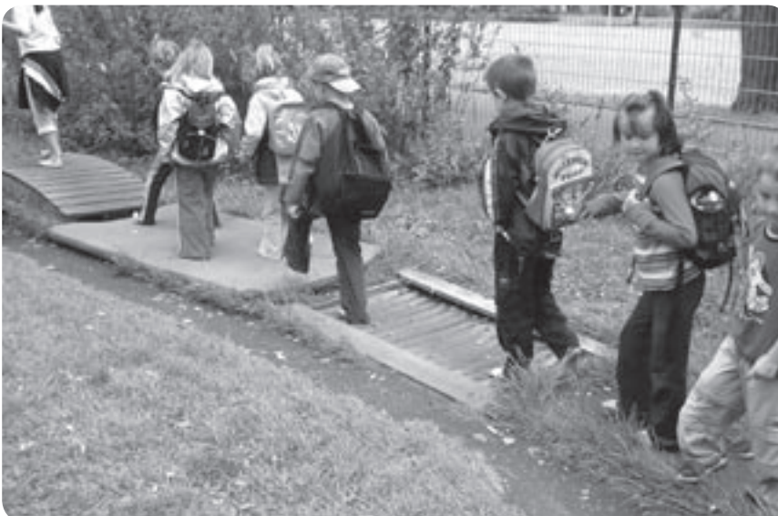
Besuch im Sinnesgarten in Nürnberg

Die Auseinandersetzung mit geometrischen Formen, Zahlen und Mengen ist daher in unserer Kindertagesstätte von großer Bedeutung. Mathematisches Denken ist die Basis für lebenslanges Lernen und umfasst alle Bereiche in der unmittelbaren Umgebung des Kindes (z. B. geometrische Formen im Zimmer oder beim Spaziergang wiederfinden, Treppen zählen, anwesende Kinder zählen, einen Apfel halbieren, vierteln, achteln ...). Bereits Krippenkinder zählen, vergleichen und ordnen spielerisch und mit viel Spaß verschiedenste Gegenstände.