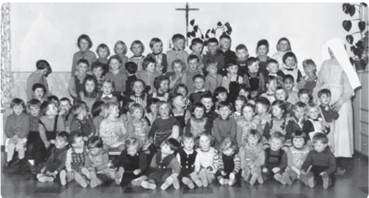
Die St.-Josefs-Anstalt 1960

Dabei unterstützen wir sie: 17 engagierte Mitarbeiterinnen mit unterschiedlicher Ausbildung von der Erzieherin, Kinderpflegerin, Heilerziehungspflegerin bis zur Sonderpädagogin, außerdem 3 Erziehungspraktikantinnen und ein Zivildienstleistender. Alle sind daran interessiert, für unsere Kinder das Beste zu erreichen. Dafür halten wir zusammen, unterstützen und ergänzen uns.