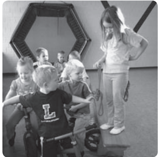
Lernen in Bewegung: „Wir spielen Ampel.“