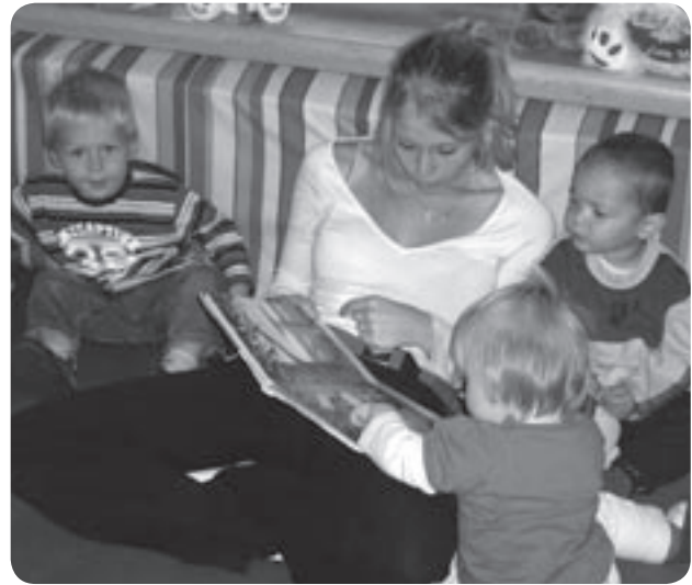
Vorlesen ist wichtig für Groß und Klein.

Die Wackelzahnkinder erleben den bewussten Umgang mit der Sprache, indem wir über 20 Wochen das Würzburger Trainingsprogramm „Hören – Lauschen – Lernen“ erarbeiten. Dadurch soll einer späteren, eventuellen Lese-Rechtschreibschwäche entgegengewirkt werden. Außerdem haben die