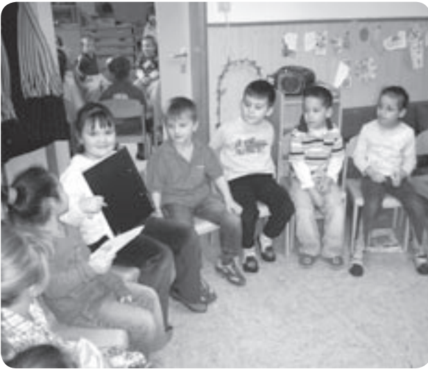
Die Kinder betrachten gemeinsam ein Buch.