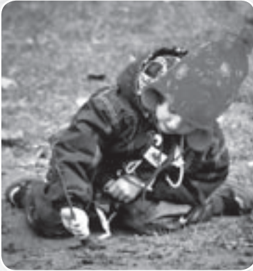
„Wo sind die Regenwürmer?“