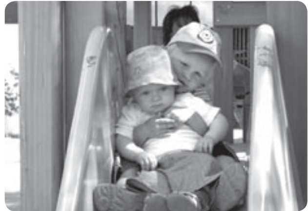
Groß und Klein trifft sich überall!