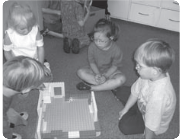
Kinder mit und ohne Behinderung spielen miteinander.

Der Tagesablauf in der integrativen Gruppe und die Arbeitsbedingungen für das pädagogische Personal entsprechen weitgehend denen anderer Gruppen. Die individuelle Entwicklung der Kinder mit besonderen Bedürfnissen ist sehr unterschiedlich. Die Unterstützungsangebote in unserer Kindertagesstätte tragen dieser Situation durch vielfältige pädagogische Maßnahmen Rechnung.