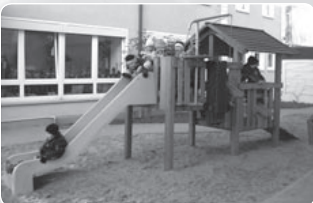
Abenteuerspielhaus im kleinen Garten