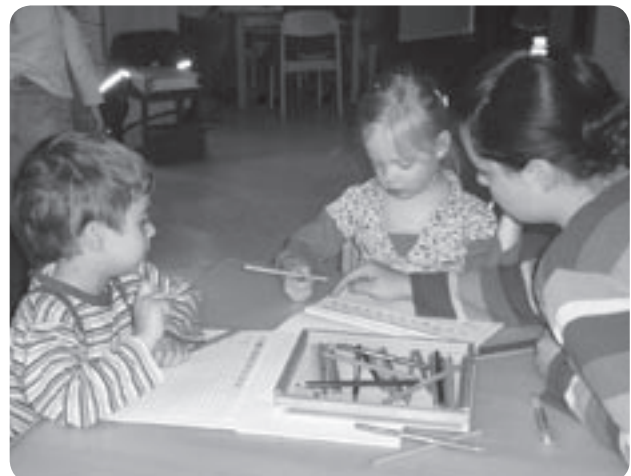
Die Kinder arbeiten in ihrer Mappe und vervollständigen logische Reihen.