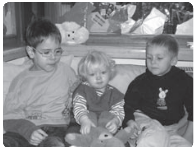
Kindergartenkinder zu Besuch in der Kinderkrippe