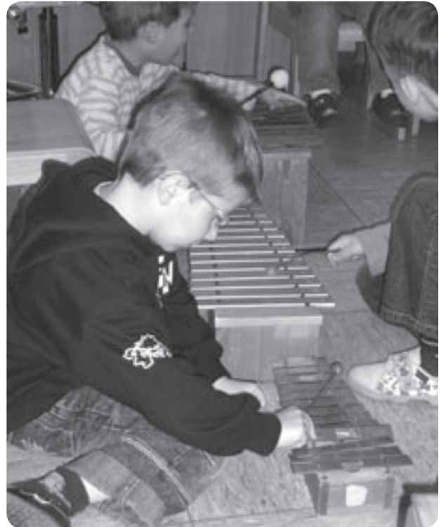
Beim Musizieren mit Glockenspiel und Xylophon

Musik kann zur Entspannung, Aufmunterung, Lebensfreude und emotionalen Stärke und damit zur Ausgeglichenheit beitragen.