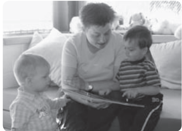
Mama und Kind erkunden zusammen die neue Gruppe.

Unsere besondere pädagogische Aufmerksamkeit richten wir auf die Planung und Begleitung in dieser ersten Phase, um den Kindern einen positiven Einstieg zu ermöglichen. Je nach Lebensalter und Entwicklungsstand bewältigt das Kind den Übergang (die „Transition“) in seinem eigenen Tempo. Kinder und Eltern bekommen die Zeit, die sie für die Eingewöhnung brauchen. Das Erleben eines erfolgreichen Neuanfanges stärkt die Kinder in ihrem Selbstbewusstsein und Selbstwertgefühl. Dies ist eine gute Basis für weitere Übergangsergebnisse.