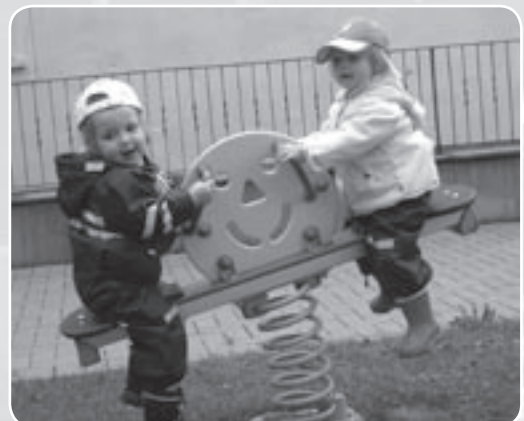
Krippenkinder auf der Mondwippe