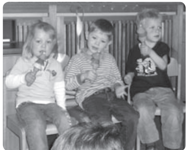
Liedbegleitung mit Glockenstab