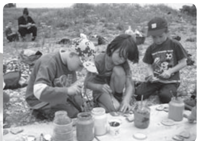
Malen mit selbst hergestellter Erdfarbe