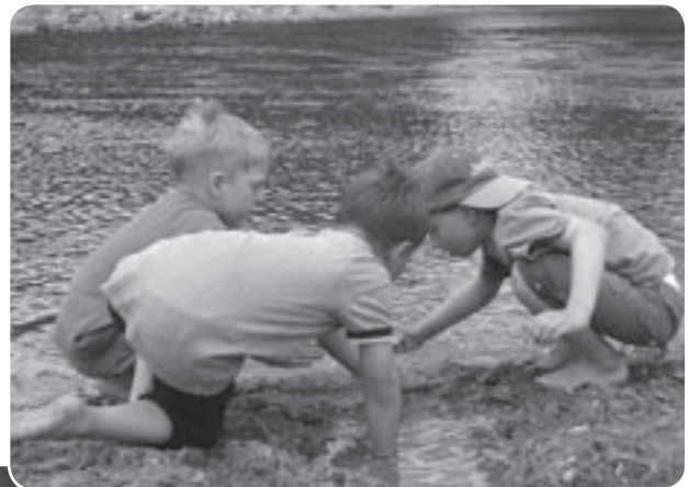
Wir erkunden unsere Umgebung ... an der Regnitz ... auf dem Bauernhof.

Wir leben in einer Marktgemeinde mit insgesamt ca. 11.700 Einwohnern und sind ins Ortszentrum fest eingebunden. Unsere Kindertagesstätte ist die älteste Institution in dieser Art. Uns ist es wichtig, an verschiedenen gemeindlichen Aktivitäten mit unseren Kindern teilzunehmen, z. B. das jährlich stattfindende Rathausfest mit unserer traditionellen Losbude oder Aufführungen am Weihnachtsmarkt. Die Kinder sollen die vielfältigen Einrichtungen in unserer Marktgemeinde kennen. Dazu gehören regelmäßige Besuche in unserer Bücherei, im Museum,