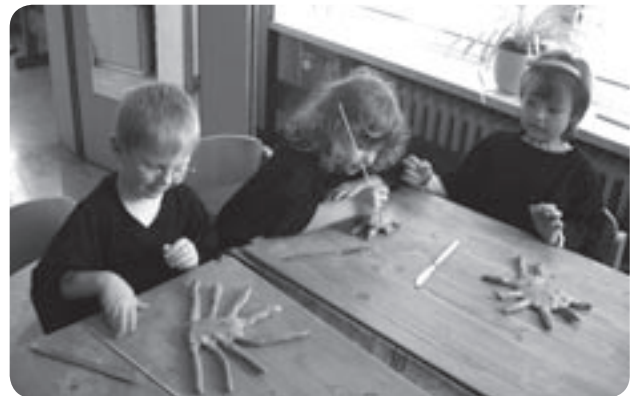
Arbeiten mit Ton

Der kreativ-künstlerische Bereich nimmt eine zentrale Rolle in der Entwicklung des Kindes ein. Hierbei sollen alle Sinne angesprochen werden, bzw. den Kindern die Möglichkeit gegeben werden, eine Verknüpfung zwischen den verschiedenen Sinnen herzustellen.