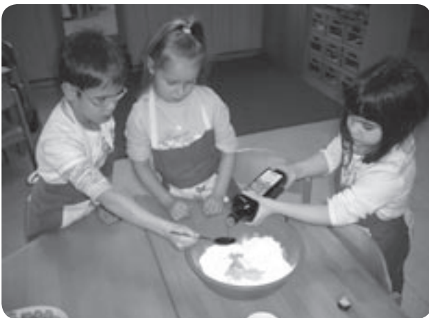
„Wenn man gemeinsam kocht, schmeckt es doppelt so gut!“

Im Personalzimmer und im Büro finden Team- und Elterngespräche statt, in der „Villa Kunterbunt“ werden Kinder einzeln oder in kleinen Gruppen u.a. von unserem Fachdienst gefördert. Küche, Putzräume, Erwachsenentoiletten und Dachboden vervollständigen unsere Räumlichkeiten.