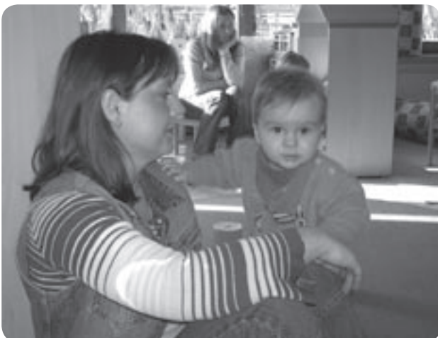
Die Mama begleitet das Kind in der Eingewöhnungszeit.

Ein großer Vorteil unserer Einrichtung besteht darin, dass durch die räumliche Nähe ein schonender Übergang in den Kindergarten stattfinden kann. Kinderkrippen- und Kindergartenkinder besuchen sich immer wieder gegenseitig, lernen sich und die Räumlichkeiten kennen. Kurz vor dem Übergang besucht das Krippenkind gezielt seine spätere Kindergarten-Gruppe und kann intensiven Kontakt zu den Erziehern und den Kindern aufnehmen. Die Erzieherinnen der Kinderkrippe bereiten die Kinder bewusst auf die neue Zeit vor. Eine Abschiedsfeier rundet die Krippenzeit ab.